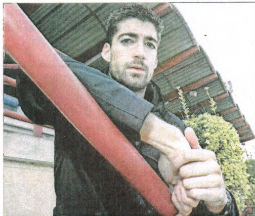
AUTOCRÍTICO. El atacante reconoció el mal momento del Valencia.

La oportunidad que se les brinde a los jóvenes debe ir acompañada por el respaldo a la vieja guardia, la misma que no hace tanto tiempo llenaba de títulos los ojos brillosos de los aficionados. Respeto. El orgullo de Cañizares, Albelda, Baraja o Orientes hincha todavía sus pechos y les invita a seguir creyendo en ellos mismos. No desconfíen de su esfuerzo. Lo difícil no fue llegar arriba, sino mantenerse entre los mejores. Y ellos lo hicieron. Pero la llamada a los jóvenes debe servir para inyectar una sonrisa en el grupo, una cara ilusionada con aquello que le rodea. En el vestuario, en el calentamiento, sobre el verde... Crecer al lado de sus ídolos, aprender desde la admiración. Mata es un grito a la revolución, un chispazo en la oscuridad. Y el resto no le van a la zaga. Dejen a los niños correr, reír, jugar... gritar.