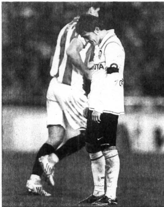
Caída libre. El Valencia no levanta cabeza en la Liga.

Lo que sí que parece complicado es que lo consiga su sustituto, el holandés Ronald Koeman, si continúa con sus números actuales ya que tan sólo ha sumado tres de los quince últimos puntos.