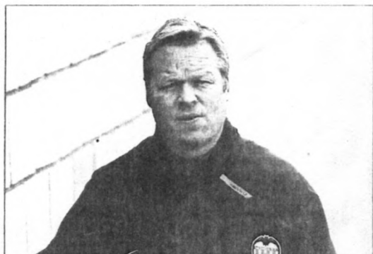
El técnico está dispuesto a levantar un nuevo equipo.

«El Valencia no está en estos momentos para entregarse a manos de gente complaciente, de esa que te da siempre lo que pides y nunca te recuerda tus errores, sino para todo lo contrario»